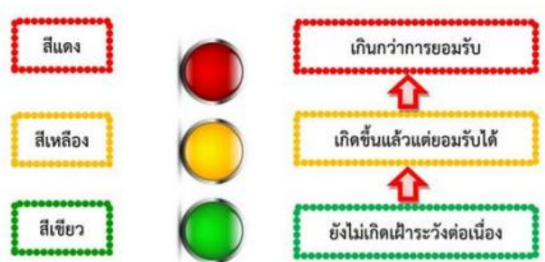
ตารางที่ ๖ ตารางจัดทำรายงานผลการเฝ้าระวังความเสี่ยง

เพื่อติดตามเฝ้าระวัง เป็นการประเมินการบริหารความเสี่ยงการทุจริตในกิจกรรมตามแผนบริหาร ความเสี่ยงของ (ขั้นตอนที่ ๕) ซึ่งเปรียบเสมือนเป็นการสร้างตะแกรงดัก เพื่อเป็นการยืนยันผลการป้องกันหรือ แก้ไข ปัญหาที่มีประสิทธิภาพมากขึ้นเพียงใด โดยการแยกสถานะของการเฝ้าระวังความเสี่ยงการทุจริตต่อไป ออกเป็น ๓ สี ได้แก่สีเขียว สีเหลือง สีแดง > สถานะสีเขียว: ไม่เกิดกรณีที่อยู่ในข่ายความเสี่ยง ยังไม่ต้องทำ กิจกรรมเพิ่ม > สถานะสีเหลือง: เกิดกรณีที่อยู่ในข่ายความเสี่ยง แต่แก้ไขได้ทันเวลาที่ ตามมาตรการ/ นโยบาย/โครงการ/กิจกรรมที่เตรียมไว้แผนใช้ได้ผล ความเสี่ยงการทุจริตลดลง > สถานะสีแดง: เกิดกรณีที่ อยู่ในข่ายยังแก้ไขไม่ได้ควรมีมาตรการ/นโยบาย/โครงการ/ กิจกรรม เพิ่มขึ้นแผนใช้ไม่ได้ผล ความเสี่ยงการ ทุจริตไม่ลดลง